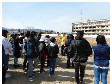
震災遺構「気仙沼向洋高校」

3月18日(日)、バスツアーを主催し、気仙沼に行ってきました。テレビで時おり気仙沼の様子を見ていましたが、実際に見ると想像以上で衝撃を受けました。来年春には震災遺構となる気仙沼向洋高校、七ヶ浜の向洋中学校と名前が同じということもあり、Fプロの子ども達は心に響くものがあったようです。