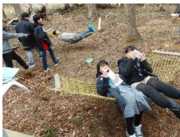
ハンモックで大はしゃぎ

また、震災後から、海の暮らしと遊び、子どもをテーマに活動されている「NPO法人浜わらす」さんとの交流では、ツリーハウスやハンモックに興じ、笑顔いっぱいの場面も見られました。震災から7年…新しい視点で七ヶ浜を見つめる良い機会となりました。