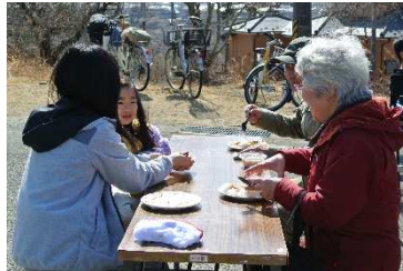
相席で楽しく食事交流

運営や食べ放題メニューの調理には地区避難所のお茶会メンバーや普段ハウスに駄菓子を買いに来る子ども達のママ、向洋中学校Fプロジェクトメンバーにお手伝いいただき、住民同士、たいへん賑やかなイベントとなりました。