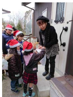
プレゼントを手渡す子ども達

12月、地区の子ども達がサンタに扮し、七ヶ浜町各地区の災害公営住宅・集団移転団地の全戸約400戸を訪れ、「クリスマスプレゼント」をお配りしました。ご高齢の一人暮らしや夫婦で暮らす世帯が増えてきているなか、震災後に新たに形成された環境の中での暮らしの様子をお伺いするとともに、子ども達との世代間交流のきっかけづくりとなりました。（※本取組の実施にあたり、住友化学株式会社様から多大なる物資の提供をいただきました。厚く御礼申し上げます。）