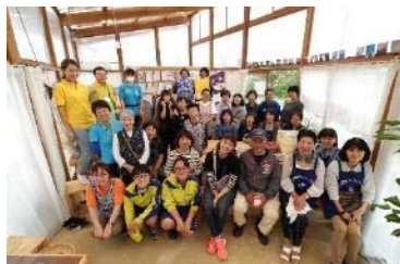
きずなネット集合写真

震災で被害を受けた菖蒲田浜の農地をボランティアさんがガレキ撤去等をして整備してできた『なならば農園』で野菜作りをしている「マザーファーム」による採れたて野菜の販売、仮設住宅に入居された方々の趣味を活かした活動が原点の「きずな工房」による手芸品の販売、『震災学習』をきっかけに発足した向洋中学校Fプロジェクトの生徒たちにお手伝いいただき、ハウスに備えられたピザ釜を使っての焼き立てピザの振る舞いなどを行いました。現在『きずなネット』には8団体に参加いただいております。各団体の活動紹介を展示し、ハウスに訪問いただいた皆様に、七ヶ浜で楽しみながら活動している様子をご紹介します。