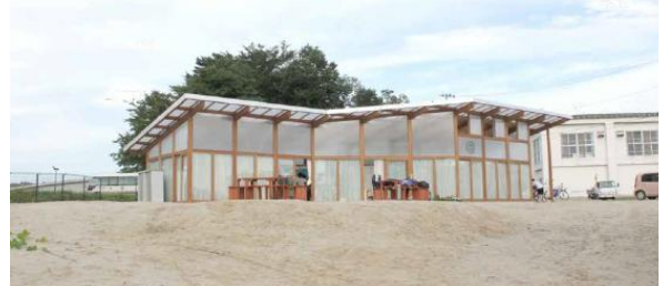
ここに樹木や草花を植えると・・・