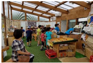
駄菓みに夢中の子供たち