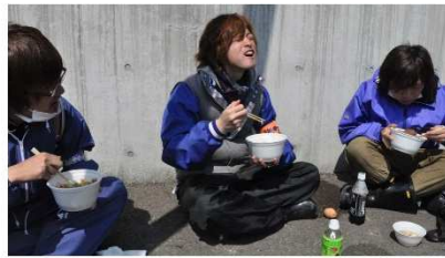
2011年3月・ボランティアへの炊き出し 『うんめえ〜！午後からの活動も頑張るぞ』

6月26日(水)から7月21日(日)まで、七ヶ浜国際村ギャラリー「海物語」にて、震災直後からのボランティアとの交流や現在のきずなハウスの様子まで、七ヶ浜に想いを寄せ、応援し続けてきたボランティアと住民の8年間を振り返る写真展を開催しました。みなさまお気に入りの写真に投票できる、参加型の写真展となっており、おかげさまで300票を超える投票をいただきました。上位3点については、しばらくの間、きずなハウスにて展示しておりますので、ぜひ足をお運びください。