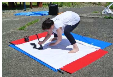
初めて見る書描の迫力に、 子ども達も見とれていました。

7月28日(日)、きずなハウスにて、「子供も大人も作る！遊ぶ！食べる！」をテーマに、県内で様々なイベントを行っているHappiness主催によるワークショップが開催されました。キャンドルすくいやネイルサロン、サンドアート、アイシングクッキー作りなど、ここには書ききれないほどのワークショップや、フードコーナーがたち並びました。他にも、みんなで描くチョークアートや書描師さんが文字を書いた大きな布にみんなで絵を描き足すなど、創造力や食欲を刺激される、とても楽しいイベントとなりました。(みんなで作ったアート作品はきずなハウスに展示します！)