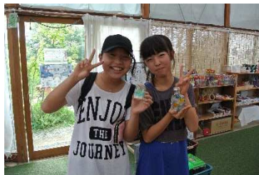
上手にできたアート作品に、 子ども達も大喜び！

今回、Happinessさんがイベントを開催する場所を探しているなか、きずなハウスのことを知り、ここで開催してくれたことを大変うれしく思います。これからも、町内外の方が、楽しく交流できる素敵な場所となれるよう目指していきます！