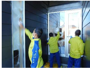
(上) みんなが気持ちよく使えるよう、避難所を掃除

10月16日(水)、松ヶ浜地区避難所にて災害公営住宅にお住まいの方をはじめ、地区住民の皆様、そして向洋中Fプロジェクトでの食事交流会を開催しました。食事交流会が始まるまで、中学生たちは、地区の花壇整備班、地区避難所の清掃班、食事(餃子づくり)班に分かれ、それぞれ一生懸命取り組みました。