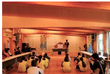
紙芝居上演の様子

今回は、震災から10年を意識し、『未来へ伝えたいこと』をテーマに、子ども達の震災体験を元にした紙芝居『みゆうとゆうみ』（きずなFプロジェクト制作）の披露や、当時、地区の防災委員や民生委員をされていた方のお話を伺ったりしました。