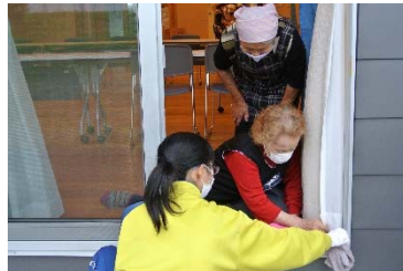
「地区の皆さんから掃除の仕方を教えてもらって、きれいになりました！」

新型コロナウイルス対策として、参加人数を制限しての開催となりましたが、「規模を縮小しても、子ども達に、この機会を作りたい」との校長先生の想いと、地区住民の皆様の協力により実施することができました。少人数での清掃活動となりましたが、全員が率先して活動することができました。