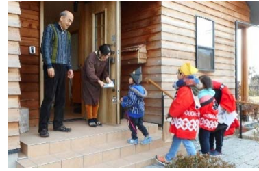
【左】 出張きずなハウス（町内各地区 で開催。写真は吉田浜） 【中央】 代ヶ崎浜もちつき大会 【右】 笹山ちゃせご