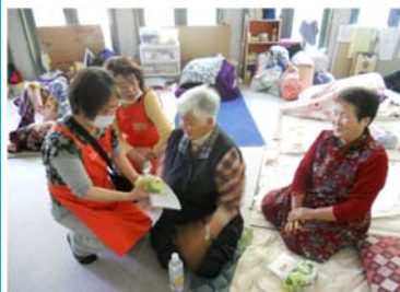
たべさいんプロジェクト 「今まで毎日食べていたであろう漬物やおひたしを食べさせてあげたい」との地元住民の方の活動をサポート。新燃岳噴火で被災した宮崎県の農家さんや愛知県安城市の農家さんが野菜を提供してくれました。

まさに飲まず食わずで活動する社協の職員さんやボランティアに駆けつけた地元の中高生さんに、「少しでも温かく、栄養のあるものを食べてもらおう!」と炊き出しを行いました。