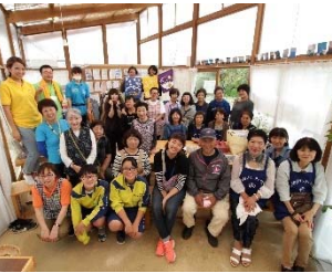
【左】 町のコミュニティ施設としての運営 【中央】 植栽を通じた交流の場「ファームガーデン」での活動 【右】 住民によるボランティアやサークル活動 団体「きずなネット」のサポート

この他にも、ここでは挙げきれないほどの様々な活動を行ってこられたのも、たくさんのボランティアさんや団体・企業の皆さまの七ヶ浜を愛する想いのおかげです。そしてまた、なによりも、自分たちの町を愛し、みんなで支え合い、一步一步前に進もうとする、七ヶ浜の住民の皆さまの力があってこそだと思います。この度、RSYによる「きずなハウス」の運営は終わることとなりますが、これまで培ってきた「きずな」を大切にしていまいたいと思います。10年間、ありがとうございました！