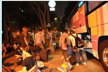
(左) ボランティアバスの派遣 72便・延べ3,133名が 七ヶ浜を訪れました。