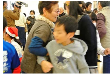
【左】 きずな食堂@松ヶ浜 【中央】 菖蒲田浜地区ぼっけ汁祭り 【右】 花渚浜クリスマス交流会