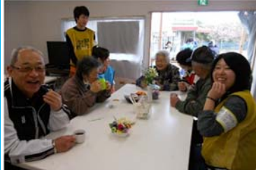
ボランティアきずな館 宿泊施設として、また、住民の皆さまとボランティアさんが交流する喫茶スペースとして運用。延べ8,000人ほどの利用がありました。