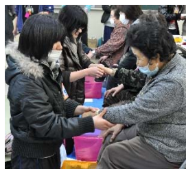
(右) 足湯 たくさんの方々から お話を聞きました。