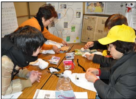
説明を熱心に聞いて作っていました

2010年1月16日(土)、アスナル金山にて「愛知・名古屋 防災&ボランティアフォーラム2010」が開催されました。この催しは、防災について身近に感じてもらうことを目的として行われたものです。当日は3人のボランティアさんと、パンダタオル手作り教室を行いました。ブースでは、阪神・淡路大震災を振り返るパネルの展示、2008年5月12日の中国・四川大地震を受けて始まった「パン