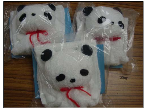
かわいいパンダタオルが完成

2010年1月16日(土)、アスナル金山にて「愛知・名古屋 防災&ボランティアフォーラム2010」が開催されました。この催しは、防災について身近に感じてもらうことを目的として行われたものです。当日は3人のボランティアさんと、パンダタオル手作り教室を行いました。ブースでは、阪神・淡路大震災を振り返るパネルの展示、2008年5月12日の中国・四川大地震を受けて始まった「パン