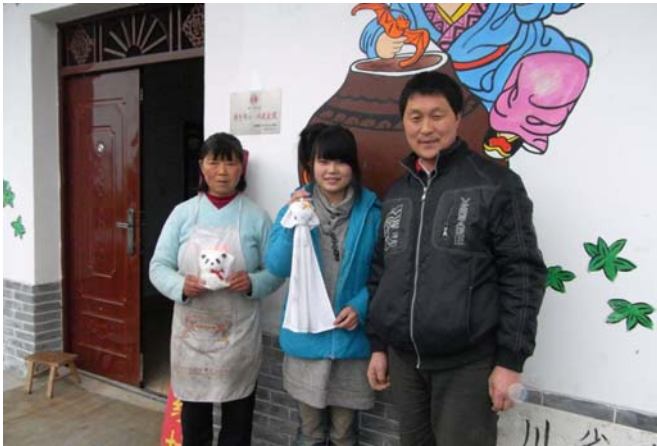
被災者の方の手に届けられたパンダタオル