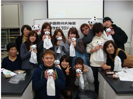
2月15日愛知淑徳大学でのパンダタオル手作り教室 ボランティアの輪が広がりました！